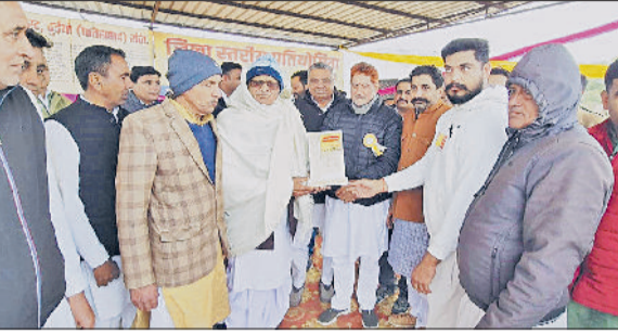
फतेहाबाद। दुईयां में सांसद सुभाष बराला का स्वागत करते ट्रस्ट सदस्य। दुईयां में आयोजित खो-खो प्रतियोगिता में दमखम दिखाती खिलाड़ी।