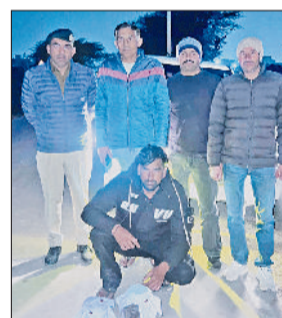
सिरसा। अवैध पिस्तौल सहित पकड़ा गया आरोपी।