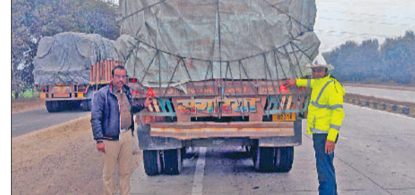
फतेहाबाद। हाइवे पर बड़े वाहनों पर रिफ्लेक्टर लगाते ट्रैफिक पुलिस कर्मचारी।

फतेहाबाद ट्रैफिक पुलिस द्वारा सड़क सुरक्षा को सर्वोच्च प्राथमिकता देते हुए धुंध एवं कम दृश्यता वाले मौसम को ध्यान में रखते हुए एक विशेष सेफ्टी अभियान चलाया गया। यह अभियान विशेष रूप से राष्ट्रीय राजमार्ग-9 पर संचालित किया गया, जहां भारी वाहनों की आवाजाही अधिक रहती है। अभियान के दौरान ट्रैफिक पुलिस टीम द्वारा एनएच-9 पर चलने वाले ट्रक, बस तथा अन्य भारी वाहनों पर सेफ्टी रिफ्लेक्टर लगाए गए। इन रिफ्लेक्टरों के माध्यम से वाहन अंधेरे, कोहरे और धुंध के समय दूर से ही स्पष्ट दिखाई देते हैं, जिससे पीछे व सामने से आने वाले