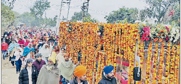
रतिया। नगर कीर्तन में भाग लेते श्रद्धालु तथा नगर कीर्तन में गतका के करतब दिखाते हुए सदस्य।