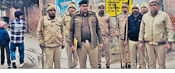
फतेहाबाद। गुरुनानकपुरा क्षेत्र में सर्च अभियान चलाती पुलिस टीम।