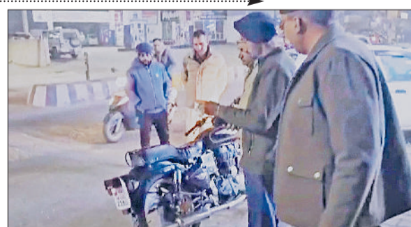
टोहाना। बुलेट मोटरसाइकिल का चालान करते हुए ट्रैफिक पुलिस।

अपराध 'ब्लूजैकिंग' के नाम से जाना जाता है।