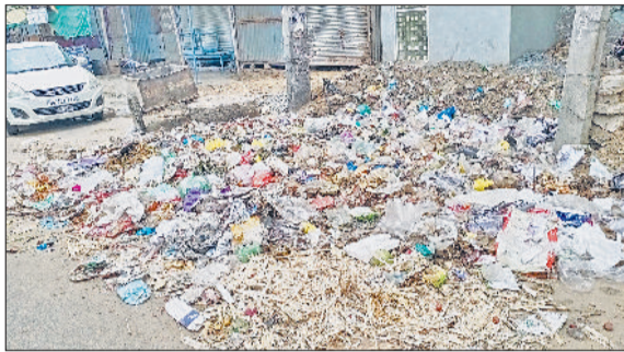
फतेहाबाद। शहर में लगा कूड़े का ढेर।

केंद्र सरकार ने स्वच्छ सर्वेक्षण 2025-26 को आधिकारिक रूप से लॉन्च कर दिया है। इस बार स्वच्छता सर्वेक्षण में खुले में शौच की समस्या पर पूरी तरह रोक लगाने और आमजन की भागीदारी को सबसे अहम माना गया है। खास बात यह है कि इस बार नागरिकों के फीडबैक का महत्व पहले से कहीं अधिक बढ़ा दिया गया है। यदि सर्वेक्षण टीम के निरीक्षण के दौरान आमजन का फीडबैक संतोषजनक नहीं रहा, तो नगर परिषद अधिकारियों के लिए मुश्किलें खड़ी हो सकती हैं। उनकी रैकिंग गिराएगी और उसी आधार पर बजट दिया जाएगा। आवास एवं शहरी कार्य मंत्रालय द्वारा शुरू किए गए इस 10वें स्वच्छता सर्वेक्षण की थीम स्वच्छता की नई पहलू के लिए मेरा शहर मेरी जिम्मेदारी सफाई हर नागरिक की भागीदारी नामक थीम रखी गई है। सर्वेक्षण कुल