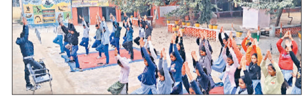
सिरसा। शिविर के दौरान योगाभ्यास करते विद्यार्थी।

में विशेष स्वच्छता अभियान चलाया। एनएसएस स्वयंसेवकों ने कक्षाओं, बरामदों, खेल मैदान तथा विद्यालय परिसर के आसपास के क्षेत्रों की साफ-सफाई कर स्वच्छ भारत मिशन के प्रति जागरूकता फैलाने का कार्य किया। इस अवसर