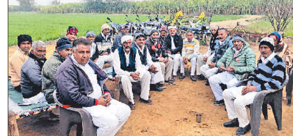
फतेहाबाद। गांव बड़ोपल में बैठक में भाग लेते किसान।