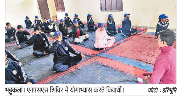
भद्रकला। एनएसएस शिविर में योगाभ्यास करते विद्यार्थी।